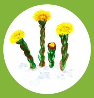
SBÍRÁNÍ LÉČIVÝCH BYLIN