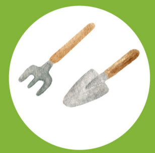
SÁZENÍ A PRÁCE Na zahrádce